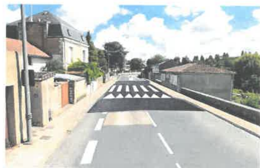
Projet d'implantation d'un plateau